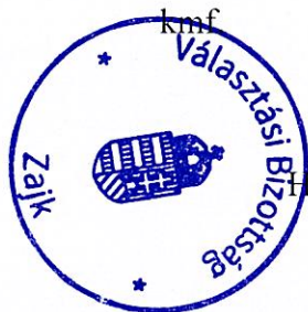
Helyi Választási Bizottság elnöke

Mivel más napirend nem volt az elnök megköszönte a részvételt, és az ülést 15.57 órakor bezárta.